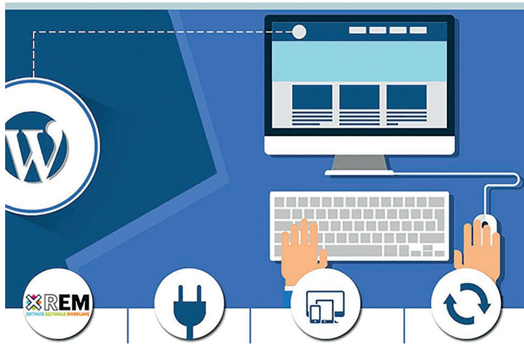
IL PROGETTO NASCE NEL 2015

gli strumenti migliori per entrare in contatto con i potenziali clienti è, senza dubbio, il sito web. I gestionali di vecchia generazione, infatti, offrono siti web scarsamente personalizzabili e impossibili da gestire e ottimizzare per i motori di ricerca (spesso, non lasciano nemmeno la pos-